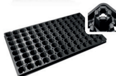
BP 2850-2,5 D/104 T