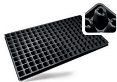
BP 3153-1,9/180 T