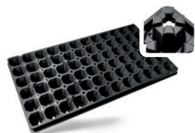
BP 2850-3,0/72 T